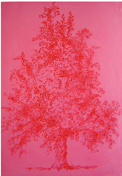
Farbbäume, 2005 - 2008 Öl auf Transparentfolie, 76,5 x 101 cm (Auswahl aus der 17teiligen Serie)